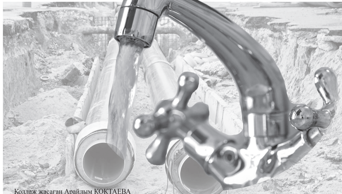
Коллаж жасаған Арайлым КОКТАЕВА

шақырымы қалаларға, 129 шақырымнан астамы ауылдарға тиесілі.