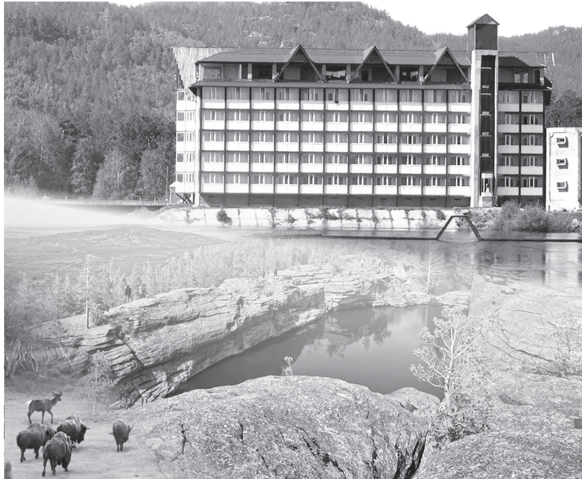
Коллекция жасаған Ш.Аманжол

Ұлттық парк аумағында жалпы ұзындығы 785,8 шақырым болатын 11 туристік маршрут бекітілген. Биыл стандарттарға сәйкес 6 млн. теңге сомағына 4 маршрутты таңбалау жүргізілді. Олар – «Шайтанкөл», «Тас ертегісі», «Үш үңгір» және «Қызыл кеніш» маршруттары.